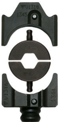
Ulompi leukapidike V1318, BNP-leuat, sisempi leukapidike V1316.