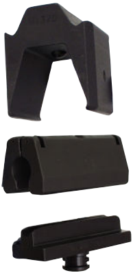
Matriisipidike V1320, matriisi R6MR, tuurna 13R6DR.