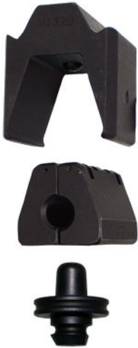
Matriisipidike V1320, matriisi P13M, tuurna P13D.